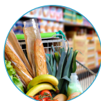
Commerce et distribution